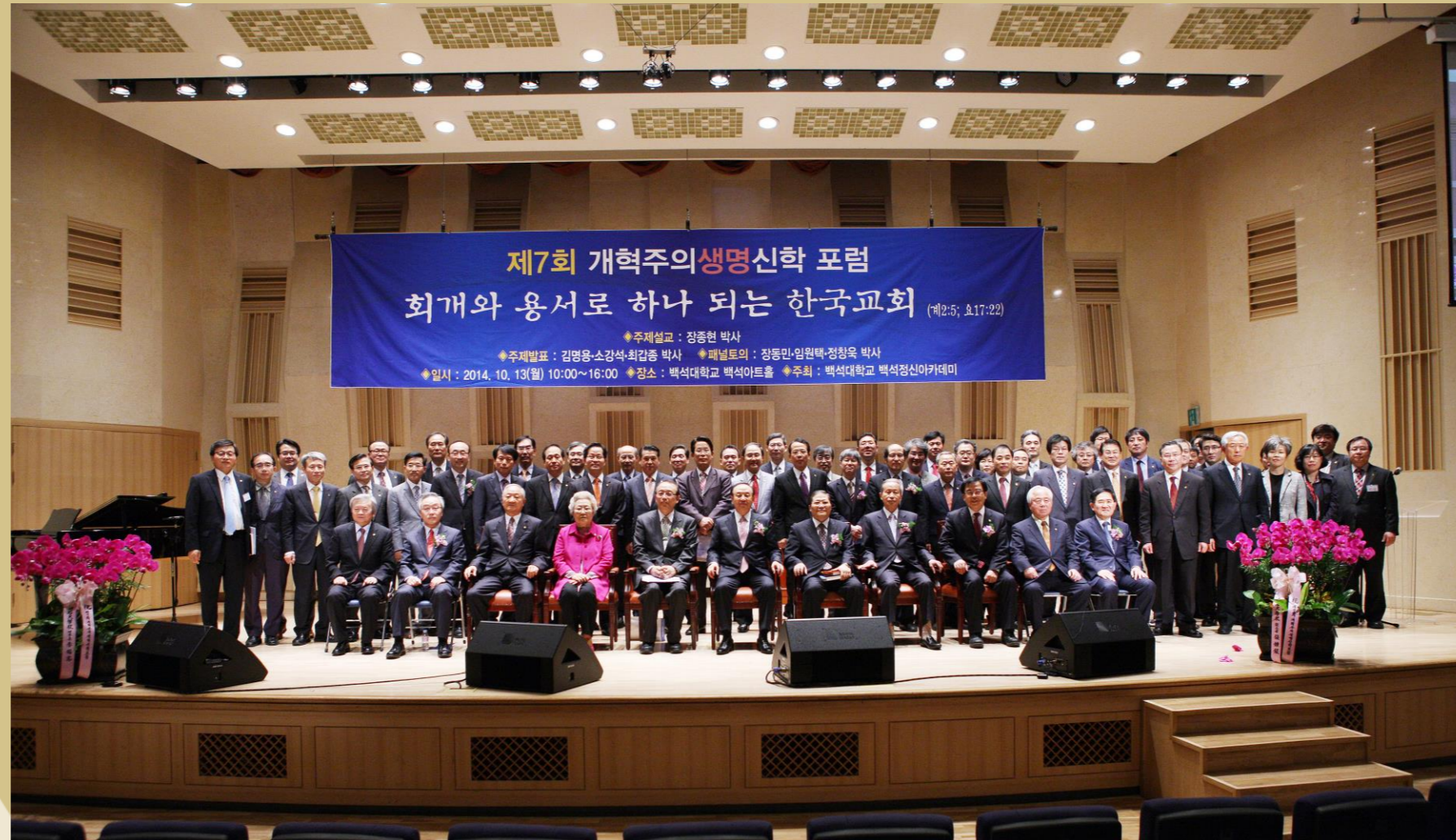
제7회 개혁주의생명신학 포럼(2014년 10월 13일)

개혁주의생명신학은 하나님 앞에서 자신을 돌아보고 서로를 용납하여 하나 되는 것을 추구하는 회개용서운동이다.