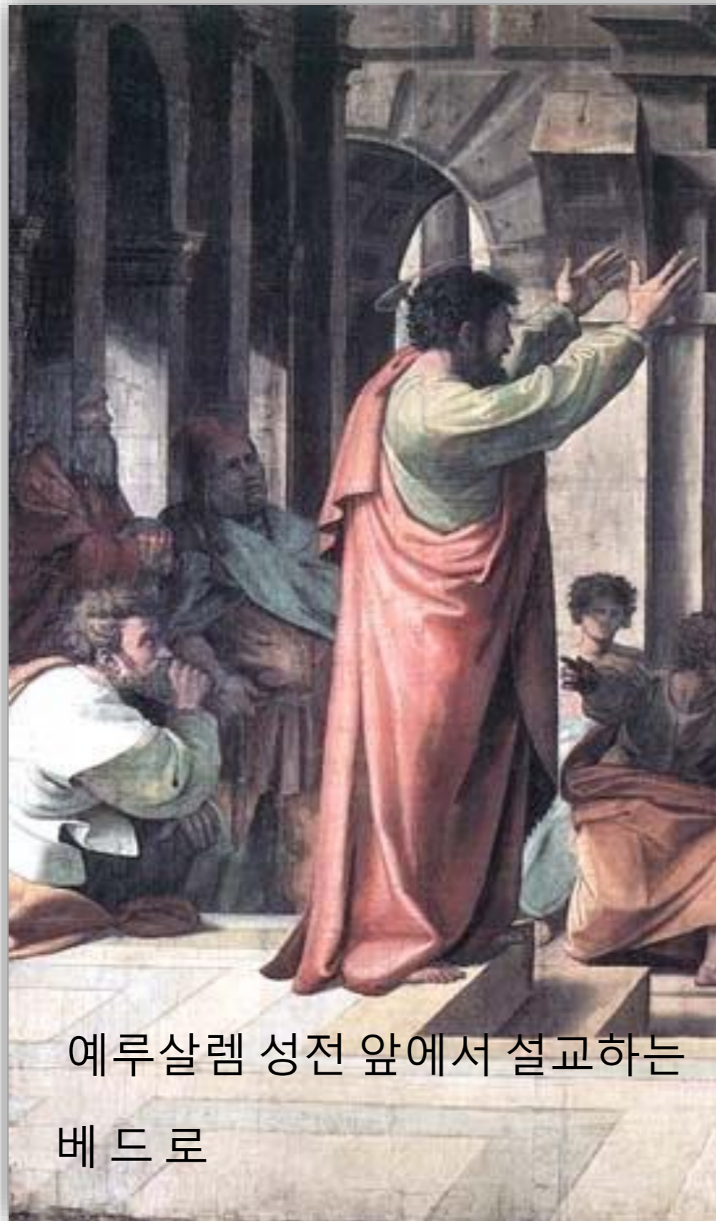
예루살렘 성전 앞에서 설교하는 베드로

2:37 그들이 이 말을 듣고 마음에 찢려 베드로와 다 른 사도들에게 물어 이르 되 형제들아 우리가 어찌 할꼬 하거늘